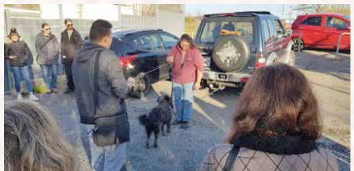
Natürlich alles unter Aufsicht von Schimanski!