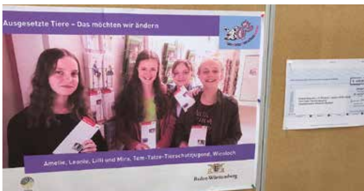
Mehr zu dem großen Erfolg der jungen Tierschützerinnen erfahren Sie in dieser Broschüre unter der Rubrik „Tierschutzjugend“.